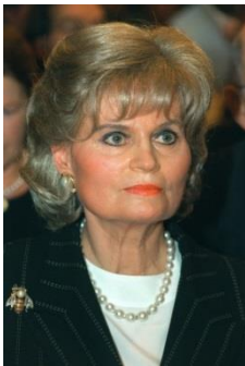
Hannelore Kohl (1933-2001) besucht die Schule von 1944-1945 Ehefrau des ehemaligen Bundeskanzlers Helmut Kohl