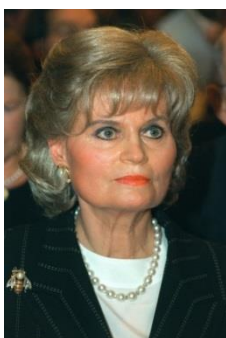
Hannelore Kohl (1933-2001) besucht die Schule von 1944-1945 Ehefrau des ehemaligen Bundeskanzlers Helmut Kohl