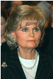
Hannelore Kohl (1933-2001) besucht die Schule von 1944-1945 Ehefrau des ehemaligen Bundeskanzlers Helmut Kohl